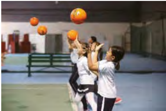
來訪學生進行運動體驗

本集團始終重視與各類中小學和高校之間的交流，我們歡迎對李寧品牌及李寧園區感興趣的學生以團隊形式參觀本集團辦公園區。2018年，本集團北京總部辦公園區共接待了來自北京小學、北大附小、朝陽區將台路小學、白家莊小學、十八里店中學等11所學校的4,431名學生。本集團安排了志願者帶領來訪學生參觀了園區的主要場所，學生們還在園區教練的指導下，實地體驗了李寧中心的各類運動設施。我們也期待通過持續開展中小學生參觀活動，讓更多的青少年更好地瞭解本集團、瞭解體育產業、愛上體育運動。