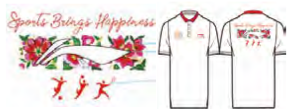
義賣產品設計圖稿

2018年5月，由中國運動員教育基金會發起人之一、執行主席李寧先生與世界冠軍們共同發起並捐資成立的中國運動員教育基金會携手本集團，以義賣的形式凝聚大家的愛心與力量，所得款項全部用於中國運動員教育基金會包括「風雨操場」及「不一樣的體育拓展」在內的體育公益活動。本集團與中國運動員教育基金會一直致力於中國貧困及偏遠地區的教育發展與體育設備的援建，至今已建設44所「中國運動員希望小學」和37所「風雨操場」以及配套的希望工程圖書室與體育教師培新項目，讓偏遠地區的孩子們體會體育的魅力，養成強健的體魄和健全的人格。